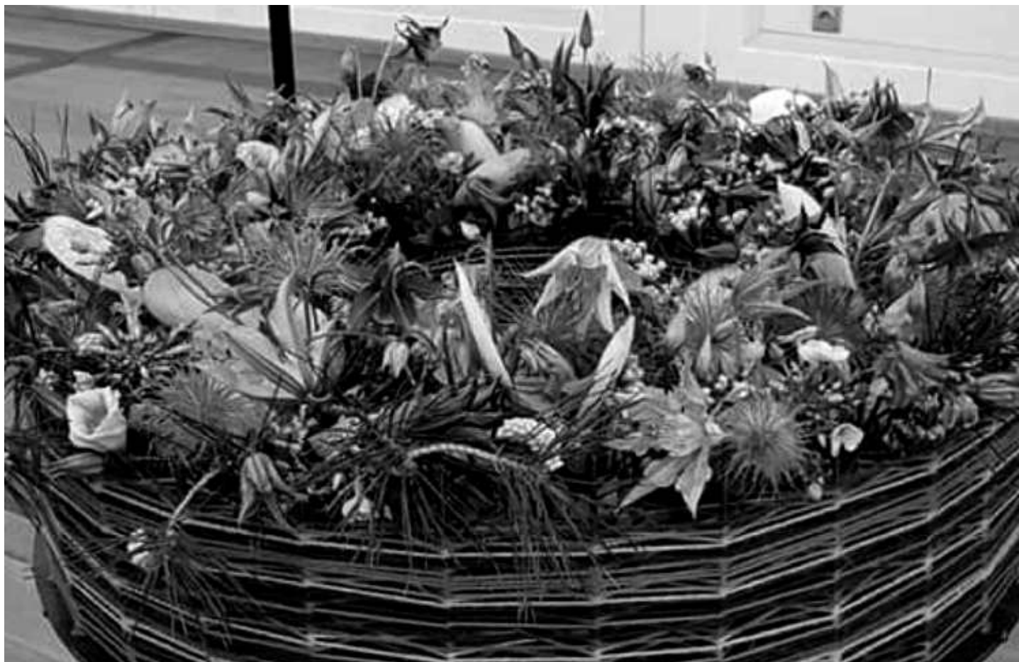
Vypichovaný věnec - autor: Vlastimil Kucharovič